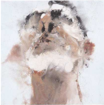
Philippe Cognée, Autoportrait III , 2001, encaustique sur toile marouflée sur bois