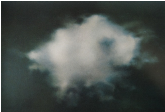
Gerhard Richter, Nuage , 1970, Huile sur toile, National Gallery of Canada, Ottawa, Canada