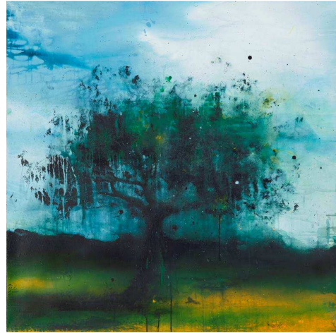
Gérald Mainier, Arbre , 2015, Acrylique sur toile, Collection Gustave et Gaspard Mainier

-dans les sujets : les deux peintres partagent les mêmes lieux de prédilection comme la vallée d'Ornans ou encore le littoral océanique