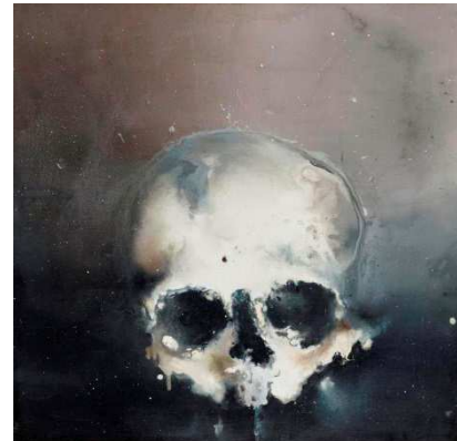
Gérald Mainier, Vanité , 2015, Acrylique sur bois, Collection Gustave et Gaspard Mainier

Pour en savoir plus sur Philippe Cognée, voir le site du FRAC Auvergne où une exposition lui a été consacrée :