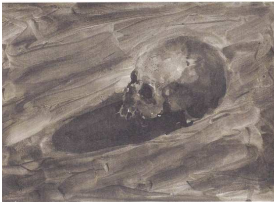
Philippe Cognée, Crâne , 2012