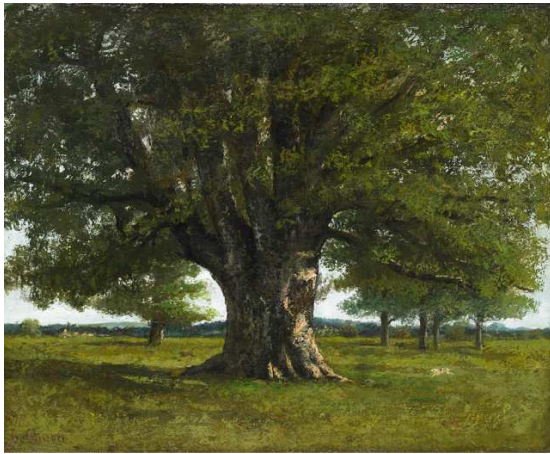
Gustave Courbet, Le Chêne de Flagey dit aussi Chêne de Vercingétorix, camp de César près d'Alésia , 1864, huile sur toile, Ornans, musée Courbet