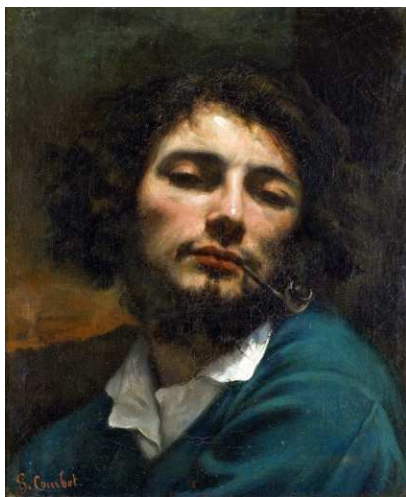
Gustave Courbet, L'homme à la pipe , 1848-49, huile sur toile, Musée Fabre, Montpellier

- au travers des genres abordés : portrait, autoportrait, paysage