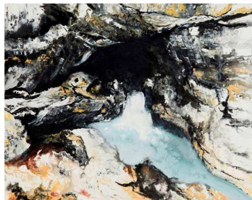
Gérald Mainier, La Source du Pontet , 2003, Acrylique sur toile, Collection Gustave et Gaspard Mainier