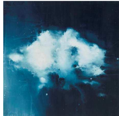
Gérald Mainier, Essai pour Nuage II , 2013, Acrylique sur toile, Collection Gustave et Gaspard Mainier

Pour en savoir plus sur Gerhard Richter, voir les pages du site du Centre Pompidou à l'occasion de l'exposition Panorama de 2012, rétrospective consacrée à l'artiste