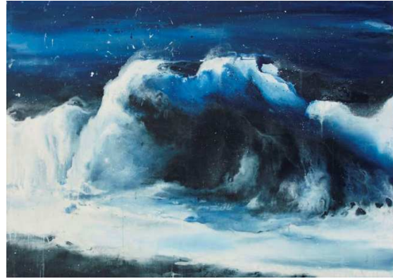
Gérald Mainier, La Vague , 2011, Acrylique sur toile, Collection Gustave et Gaspard Mainier

- dans un même intérêt pour le travail sur la matière : empatement chez Gustave Courbet, à l'inverse, dissolution et coulures chez Gérald Mainier