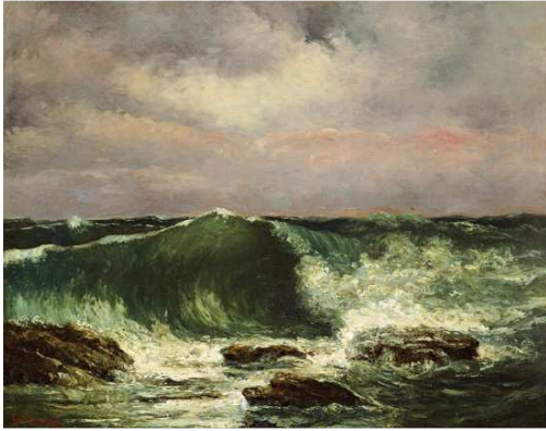
Gustave Courbet, La Vague , vers 1870, huile sur toile, Musée national de l'art occidental, Tokyo, Japon