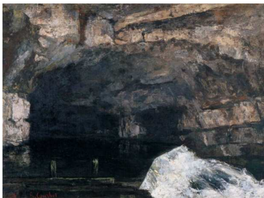
Gustave Courbet, La Source de la Loue , 1863-1864, Huile sur toile, Kunsthhaus, Zurich.

-dans les sujets : les deux peintres partagent les mêmes lieux de prédilection comme la vallée d'Ornans ou encore le littoral océanique